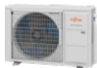
Dla ASYG12/14KETA i ASYG12/14KETA-B