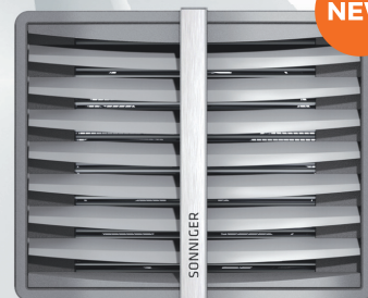
CR3 MAX | CR4 MAX