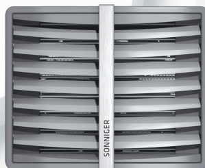
CR1 | CR2 | CR3